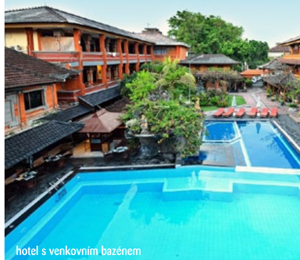
hotel s venkovním bazénem