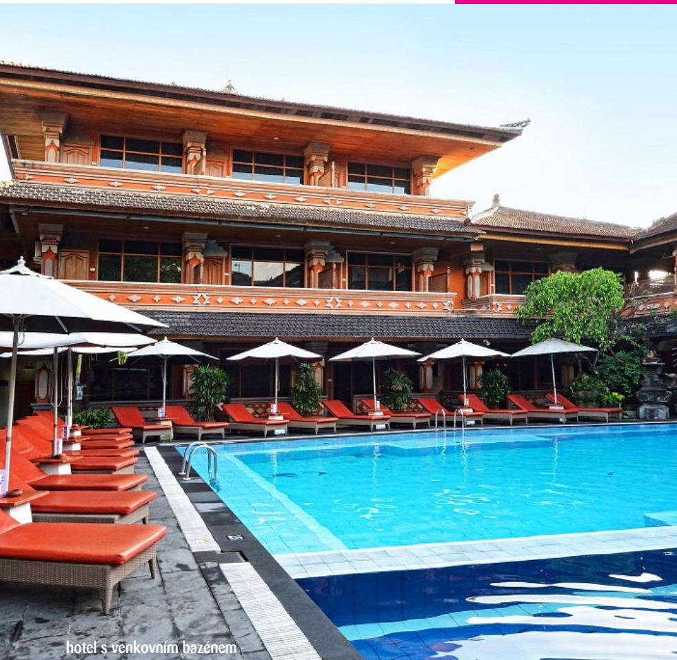
hotel s venkovním bazénem