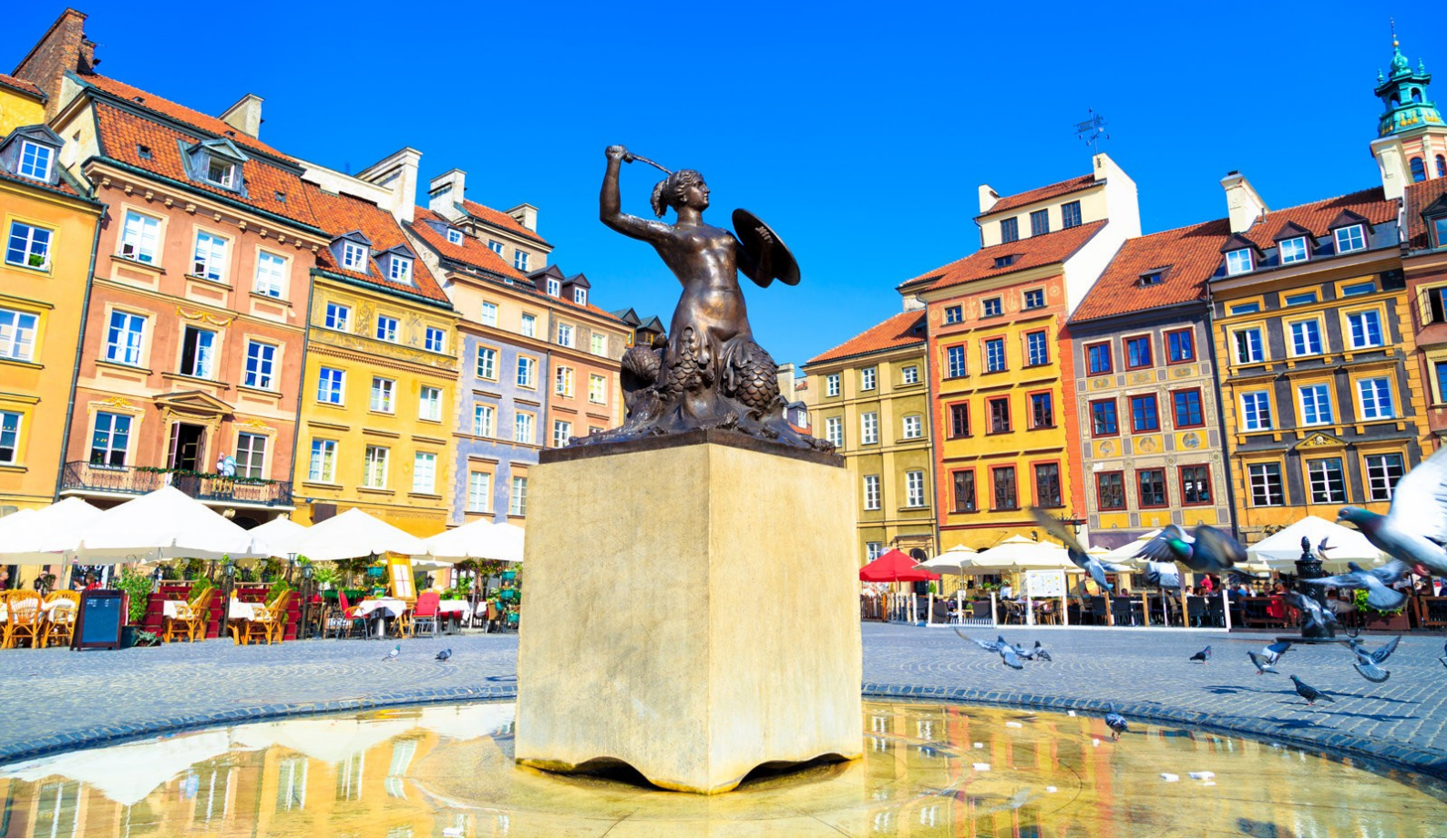
Varšava nové Staré město